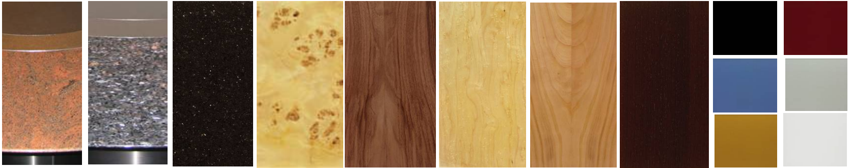
Granite multicolore rouge

Différentes possibilités vous sont offertes pour personnaliser votre table