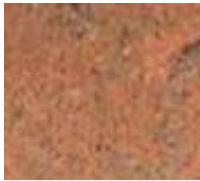
Granite multicolore rouge