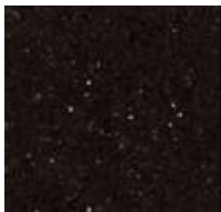
Granite galaxie noire