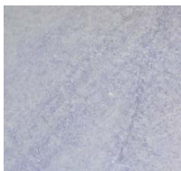
Granite bleu macaubas